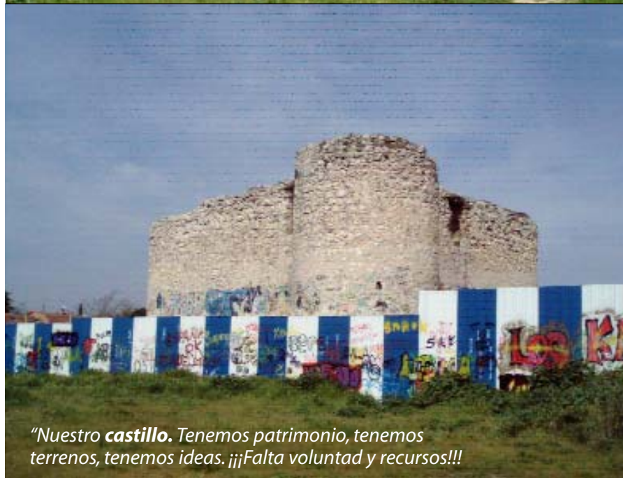
"Nuestro castillo. Tenemos patrimonio, tenemos terrenos, tenemos ideas. ¡¡¡Falta voluntad y recursos!!!"