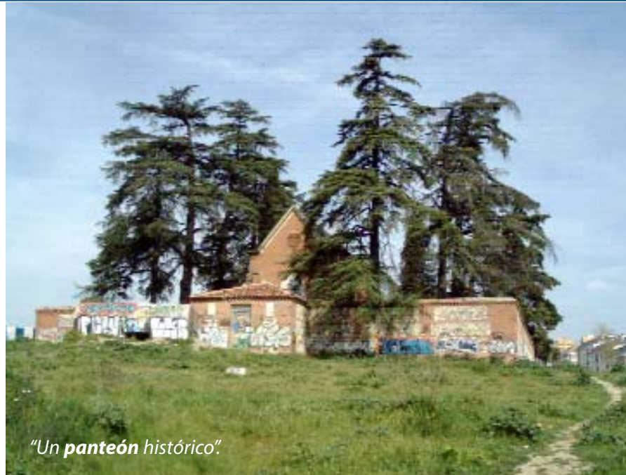
"Un panteón histórico"