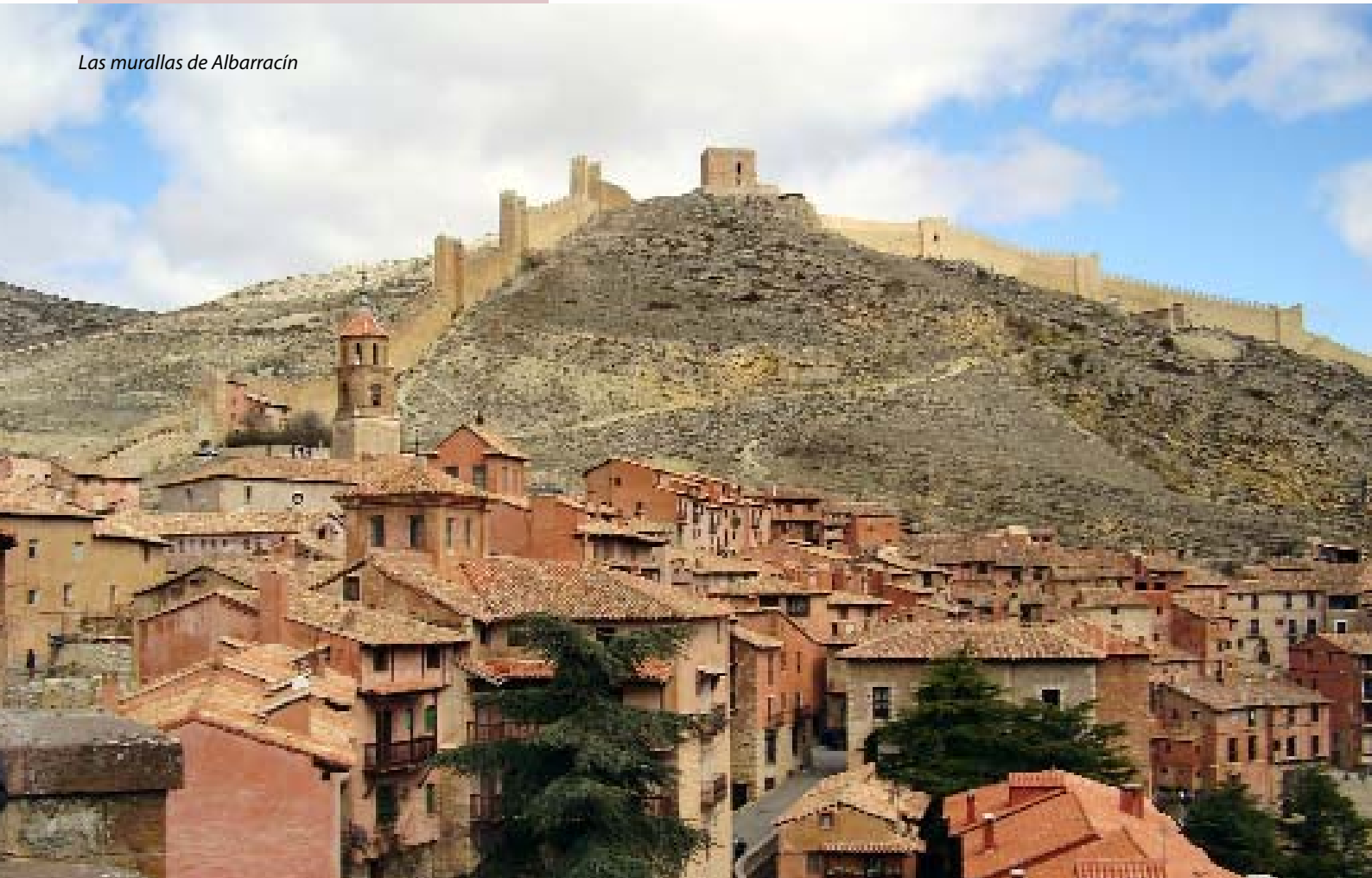
Las murallas de Albarracín