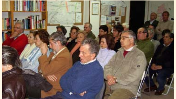
Aspecto que presentaba el salón de nuestra Asociación.

BUEN AMBIENTE, EN UN RECINTO REPLETO, PERO SIN PUROS.