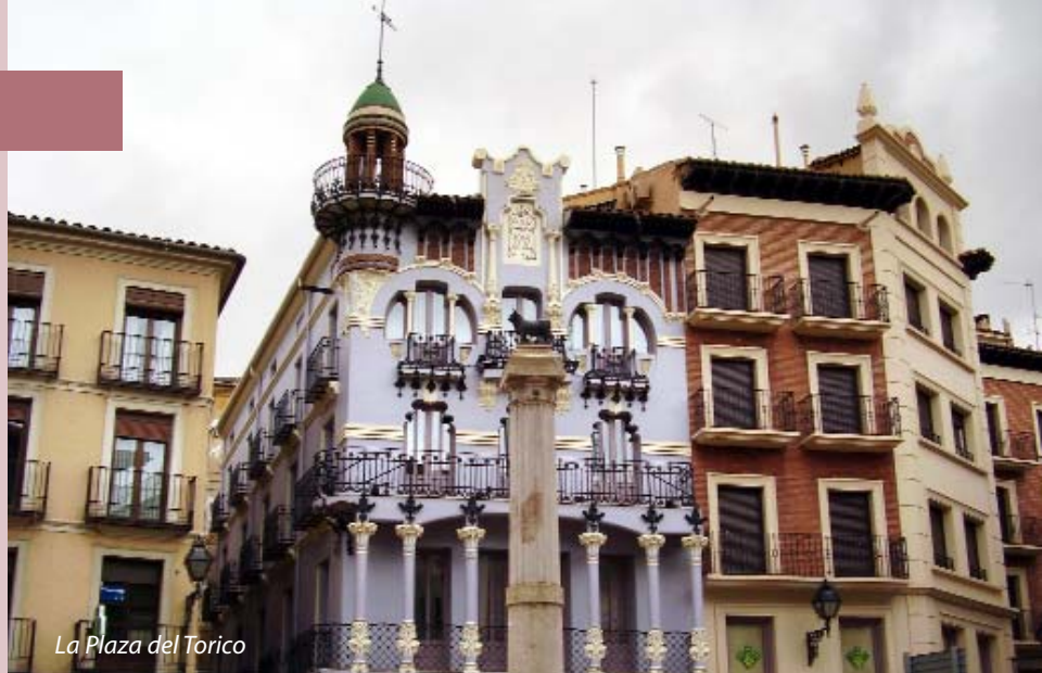
La Plaza del Torico

El monumento principal de Albarracín es la ciudad misma.