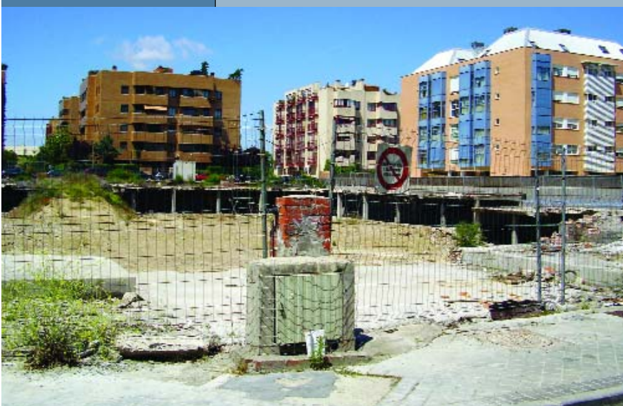
Lugar en donde este buen vecino construye sus sueños.