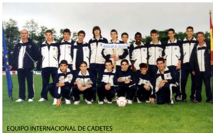
EQUIPO INTERNACIONAL DE CADETES

Mención especial merece el equipo de cadetes que pueden presumir de ser "INTERNACIONALES" ya que durante los días 24, 25, 26 y 27 de mayo se desplazaron a Francia, hasta la localidad de Le Vigneux de Bretagne para competir en un torneo de 32 equipos de diferentes países de toda la Comunidad Económica Europea. Aunque la clasificación final fue del puesto 23 hay que destacar que fue el quipo más joven de todo el torneo.