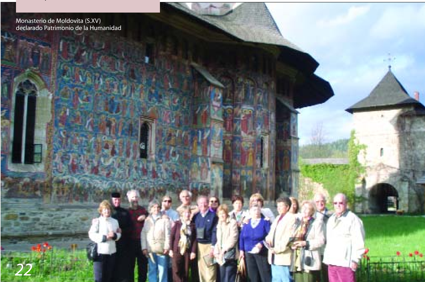
Monasterio de Moldovita (S.XV) declarado Patrimonio de la Humanidad

Fue un día oscuro por el tiempo pero claro y agradable por el arte que pudimos admirar y disfrutar.