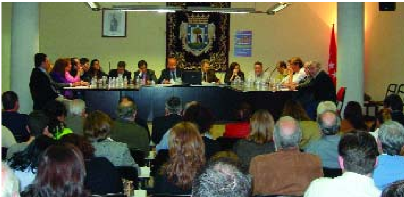
"Último Pleno Municipal en el Distrito de Barajas"