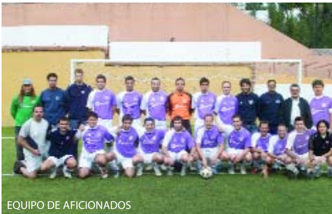
EQUIPO DE AFICIONADOS

Esta escuela lleva funcionando desde el año 1991 y desarrolla sus actividades en el campo de fútbol que se encuentra enfrente del "PARQUE DEL CAPRICH0" y ya es un hecho que a partir del mes de septiembre, cuando comience la temporada 2007/2008 se hará realidad la máxima ilusión de todos los componentes de la Escuela, es decir el campo de fútbol será de "HIERBA ARTIFICIAL".