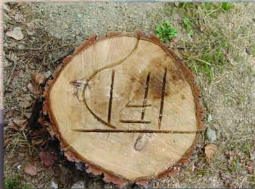
Árboles aparentemente sanos