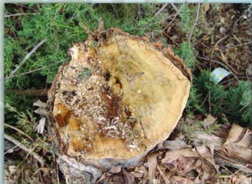
Árboles aparentemente enfermos