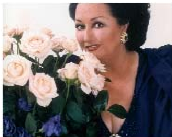
Montserrat Caballé colabora con Mensajeros de la Paz desde nuestros inicios.

El Patronato de la Asociación Mensajeros de la Paz acordó por unanimidad proponer a Dña. Montserrat Caballé, quien lleva desde nuestros inicios colaborando con nuestra Asociación, en poner a esta residencia su nombre, en homenaje a ella. Por supuesto que aceptó y nos apostilló que para ella es todo un honor que un Centro de Personas Mayores lleve su nombre. ■