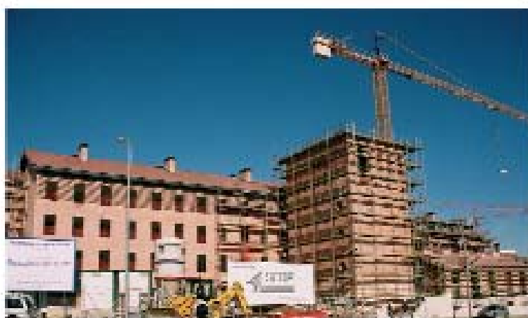
Imagen de la construcción de la residencia.

Ofrece 160 plazas residenciales destinadas a mayores con Alzheimer y a personas con necesidades de cuidados paliativos y 40 plazas de Centro de Día para mayores