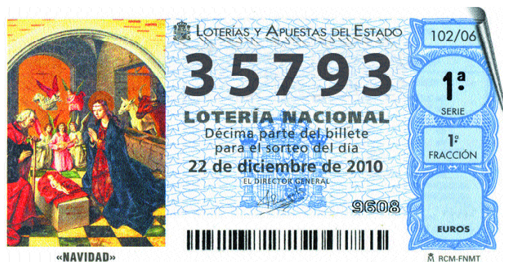
«NAVIDAD» Natividad de Cristo, de Pedro Berruguete (s. XVI), óleo sobre tabla. Retablo Mayor de la Iglesia de Santa Eulalia, Paredes de Nava (Palencia).

"Tenemos en la Asociación a disposición de todos, LOTERIA DE NAVIDAD con el número "35793"