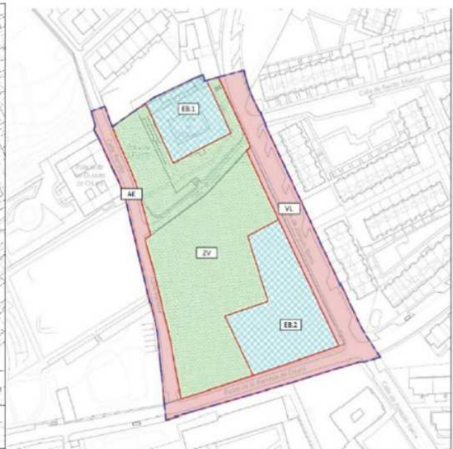
Calificación según Plan Especial Duquesa de Osuna